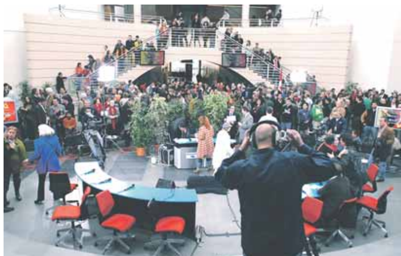
Vue du hall d'Uni-Mail.

Libertés, mode d'emploi. Etre citoyen, citoyenne dans sa commune, son canton, son pays, Chancellerie d'Etat, Genève, 2005.