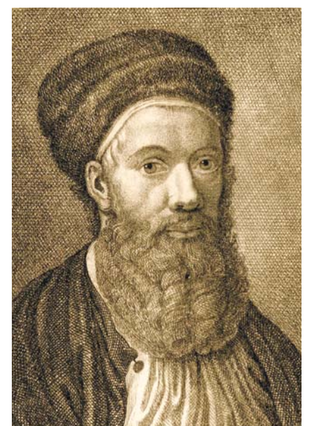
Jean Etienne Liotard (1702-1789)