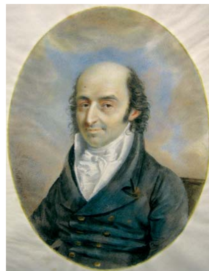
Albert Gallatin (1761-1849)