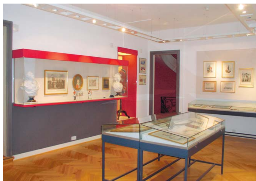
L'une des salles du Musée des Suisses dans le monde, situé au domaine de Penthes à Pregny-Chambésy.

Votre rendez-vous avec les bonnes adresses en page 7