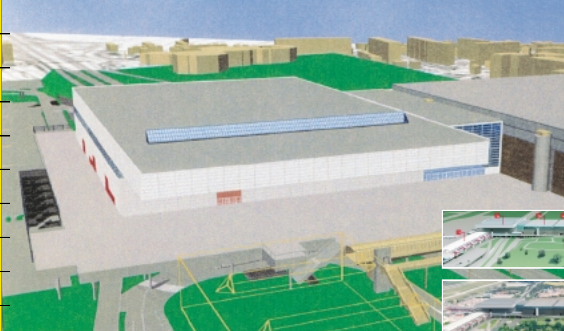
HALLE 6: Image virtuelle en 2000, le projet est devenu réalité.