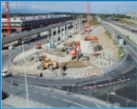
Juin 2000 - Mise en place du chantier et premières installations.