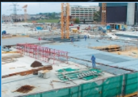
Mai 2001 - Achèvement de la plate-forme au-dessus de l'autoroute.