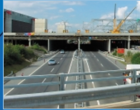
Août 2001 - Première poutre principale (110 mètres entre appuis).