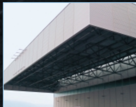
Septembre 2002 - Pose des façades.