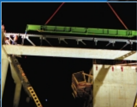
Décembre 2000 - Pose de nuit de poutres préfabriquées.