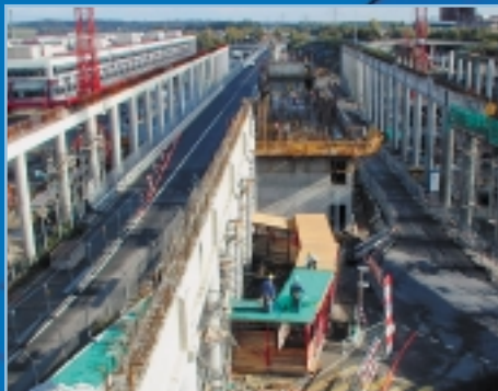
Novembre 2000 - Une forêt de piliers.