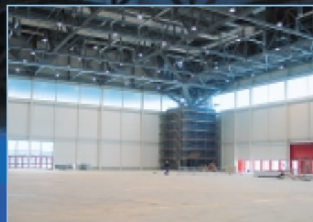
Décembre 2002 - Finition des travaux à l'intérieur de la Halle 6.