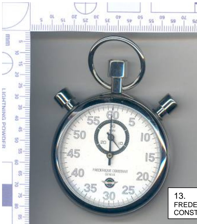
13. FREDERIQUE CONSTANT