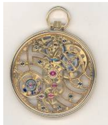
15. AUDEMARS PIQUET