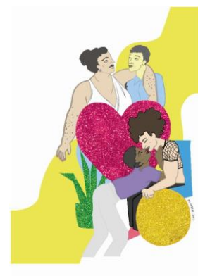
Illustration : Lari Medawar

Samedi 25 mai – Salle GamMAH – 17h00 – entrée libre