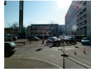
4. Parcelle paroisse Ste-Clotilde Un projet a été mis au point avec la Paroisse. Il comprend la construction d'un immeuble de logements et l'aménagement d'une nouvelle place publique. Le chantier est en cours.