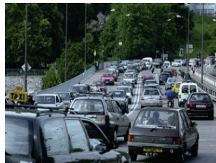
3. Mise en place d'une zone 30km/h dans l'ensemble du quartier La zone 30 km/h est encore en projet.