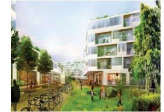
7. Ecoquartier Jonction Les travaux d'assainissement et de dépollution sont achevés. Les requêtes pour la construction des bâtiments de logements et d'activités sont presque toutes délivrées. Le bâtiment de la FVGLS est achevé.