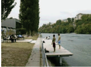
1. Sentier des Saules Acquisition du sentier par la Ville en 2010. Aménagement de pontons pour la baignade