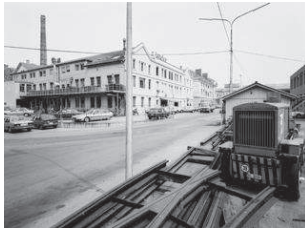
1. Pointe de la Jonction L'ancienne usine Kugler a été transformée pour accueillir des ateliers d'artistes et des pontons de baignade ont été aménagés à la pointe. Le projet plus global de requalification de la pointe, piloté par l'Etat, est en suspens.