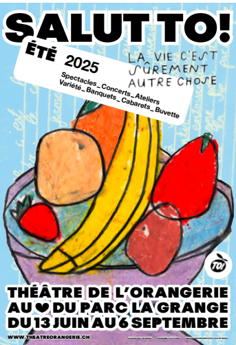
Illustration: Joe Dessin. Graphisme: Clay Studio