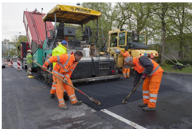
Les travaux de pose de phonoabsorbant.