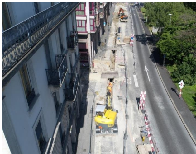
La pose de collecteurs rue du Grand-Pré