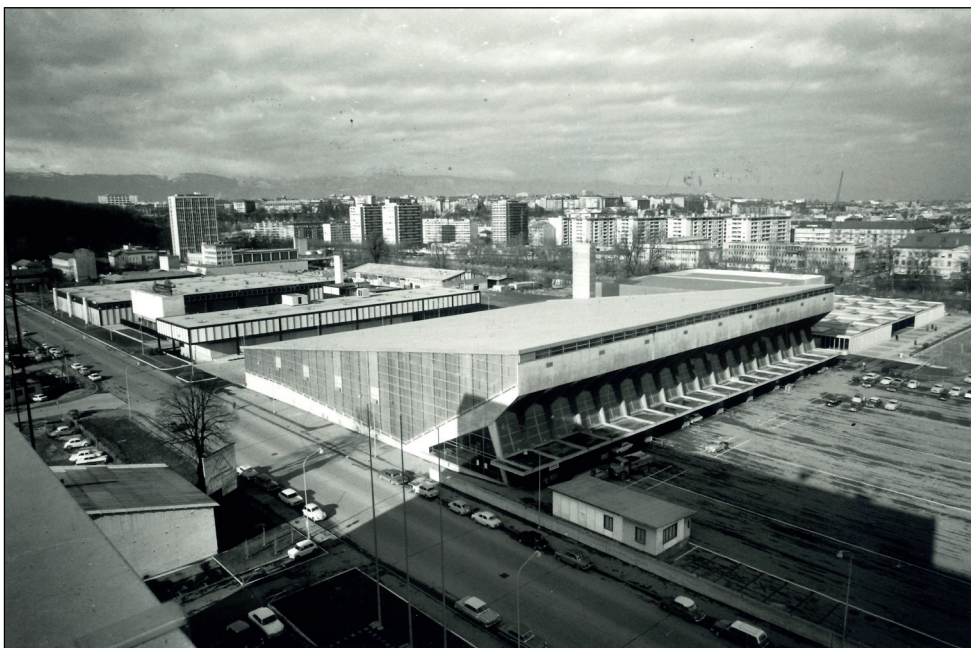
Vue générale, 27 janvier 1967.