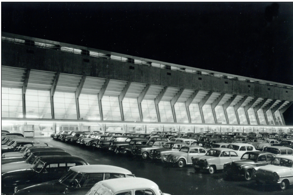
Façade principale et esplanade de nuit, février 1960.