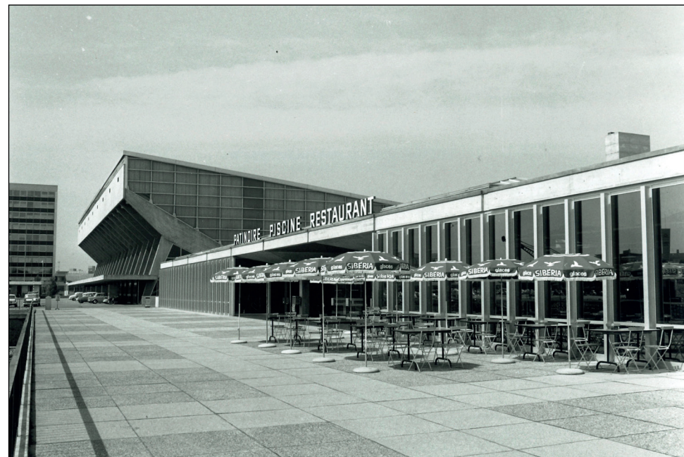
Esplanade, 27 janvier 1967.