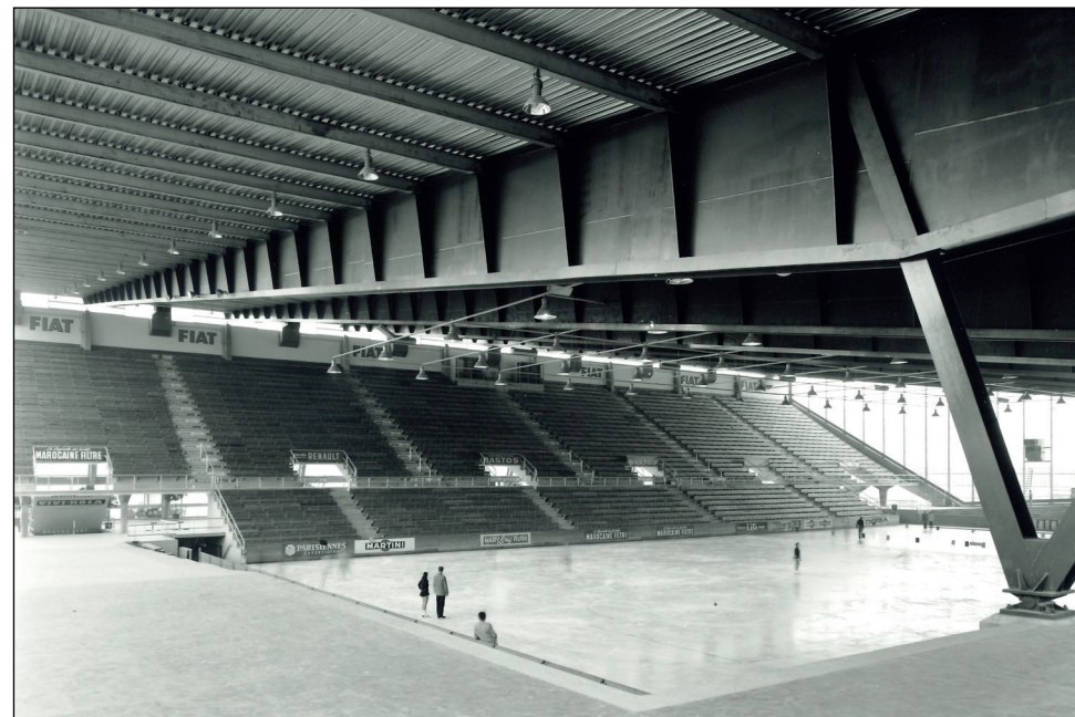
Vue intérieure, 20 janvier 1959.