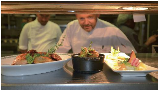
Brasserie Lipp

Autres communes : Café de Certoux, Le Cigalon (Thônex), La Chaumière (Troinex), Café du Marché (Carouge), Seventy5 (Cointrin)