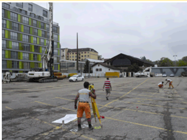
Chandieu avant la construction de l'école

Tendance : bon rythme d'avancement du programme