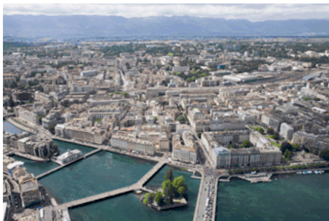
Genève, la plus petite des villes internationales