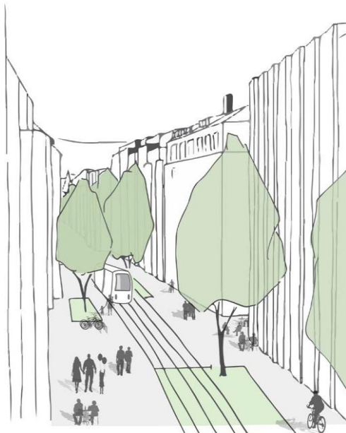
Intention d'aménagement

La rue de Carouge sera entièrement réaménagée, végétalisée et piétonnisée entre le rond-point de Plainpalais et la place des Augustins. L'objectif est de requalifier l'espace public, d'améliorer les mobilités douces et d'introduire une part importante de végétation. Ainsi, à des travaux prévus initialement sur les infrastructures uniquement, vient s'ajouter aujourd'hui un nouveau projet de réaménagement qui offre une réelle plus-value en termes de convivialité, de confort des déplacements doux et de lutte contre les îlots de chaleur.