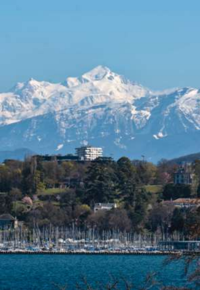
Illustration de couverture