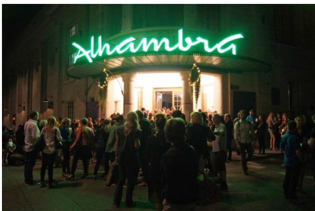
La salle de l'Alhambra inaugurée en 2015.

Genève dispose de nombreux lieux d'excellence culturelle. Cependant, les infrastructures sont vieillissantes et la fréquentation de ces lieux est relativement stable.