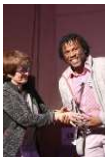
Lauréat 2019 Prix Martin Ennals

La Ville a soutenu 169 actions de coopération au développement et de promotion des droits humains dans 43 pays, menées par 109 organisations, dont 35 membres de la Fédération genevoise de coopération (FGC). 87 actions sont suivies par la Délégation Genève Ville solidaire , et 82 actions sont suivies par la FGC. Tous les projets concernent un ou plusieurs objectifs de développement durable (ODDs 1, 3, 4, 5, 10, 16) : la lutte contre la pauvreté et les inégalités, la promotion de la santé, de l'éducation et de l'égalité, ainsi que la promotion de la paix, justice et institutions efficaces. Nombreux projets impactent par ailleurs l'environnement, par exemple via une agriculture durable, l'adaptation aux changements climatiques ou encore la protection des Peuples autochtones.