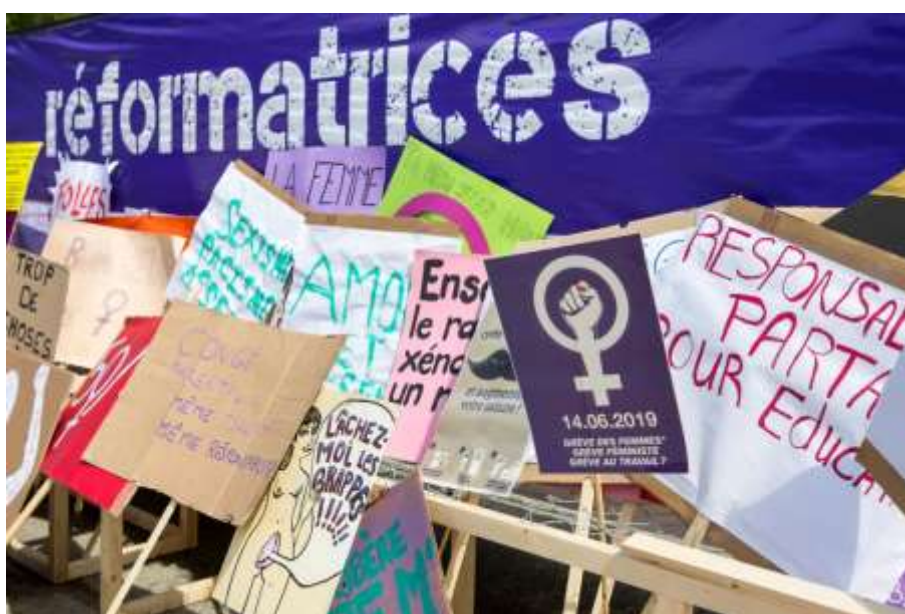
Bastions de l'égalité, juin 2019