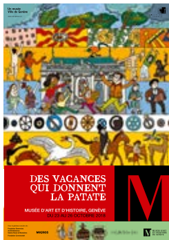
Illustration : Adrienne Barman