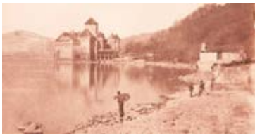
Jean Walther, Rives du Léman et château de Chillon, vers 1849, calotype, 141 × 168 mm