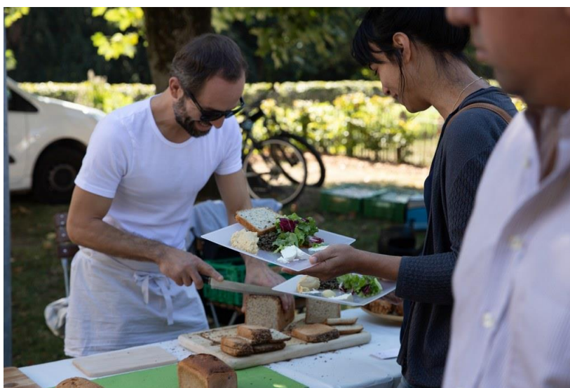
Festival du terroir à la Ferme de Budé, septembre 2018