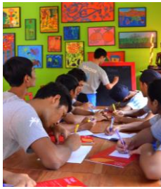
Association Friends international Cambodge