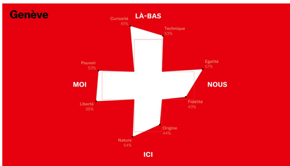
Le drapeau NEXPLORER genevois

Les premiers résultats de l'enquête font apparaître les similitudes et les différences entre les dix villes. Par exemple, la valeur la plus forte de la croix suisse genevoise est la curiosité. Elle entraîne les Genevois-e-s vers le « LÀ-BAS » de NEXPLORER, étirant leur profil vers le haut, tandis que le « ICI » genevois s'oriente davantage vers la nature que vers ses origines. Dans le « NOUS » genevois, l'égalité prime plus que la fidélité. Même si l'affinité genevoise pour le pouvoir est un peu plus prononcée que celle des autres villes participantes, c'est la liberté qui arrive le plus haut.