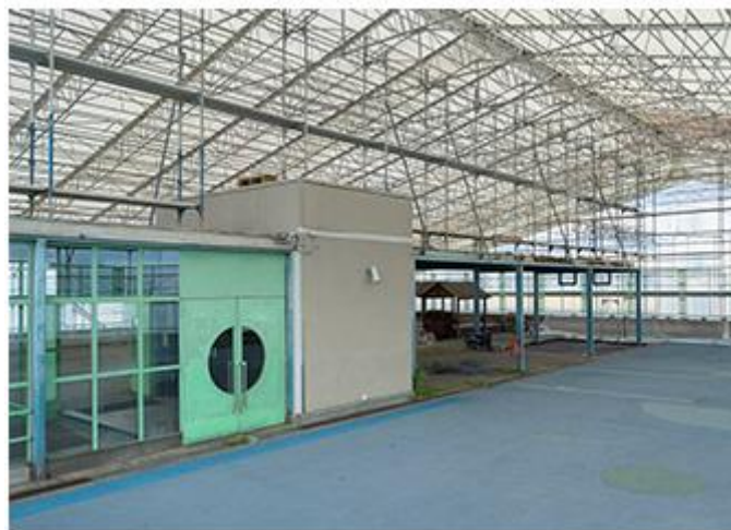
Rénovation école primaire des Pâquis