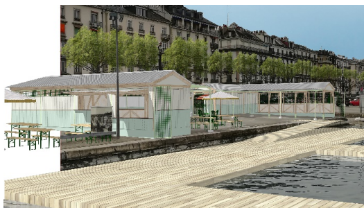
Plan des Bains du Jet d'eau

A la suite de l’approbation par le Conseil municipal de la PR-1584, des bains flottants temporaires seront installés sur le quai Gustave-Ador en aval du Jet d’eau durant l’été 2024 pour cinq saisons. Cette zone de baignade sera accompagnée d’une buvette, de douches, de vestiaires, de casiers et d’un espace de détente ombragé.